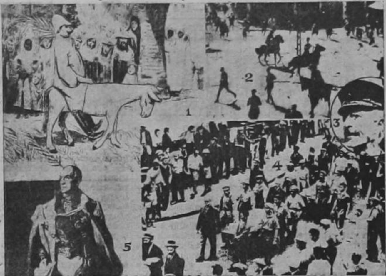
1—Caricatura francesa del Kaiser entrando a Jerusalén en los días de la política alemana "hacia el Oriente". 2—Fotografía de los recientes disturbios en Jaffa (Palestina). 3—Sir Arthur Wauchope, alto comisionado británico en Palestina, a quien los árabes llaman el peor enemigo de la Palestina. 4—Los judíos entran a sus muertos en Tel Aviv. 5—Lord Reading, gran judío inglés que fué Ruffis Isaacs luego Barón, Vizconde, Conde, Marqués y Virrey de la India.